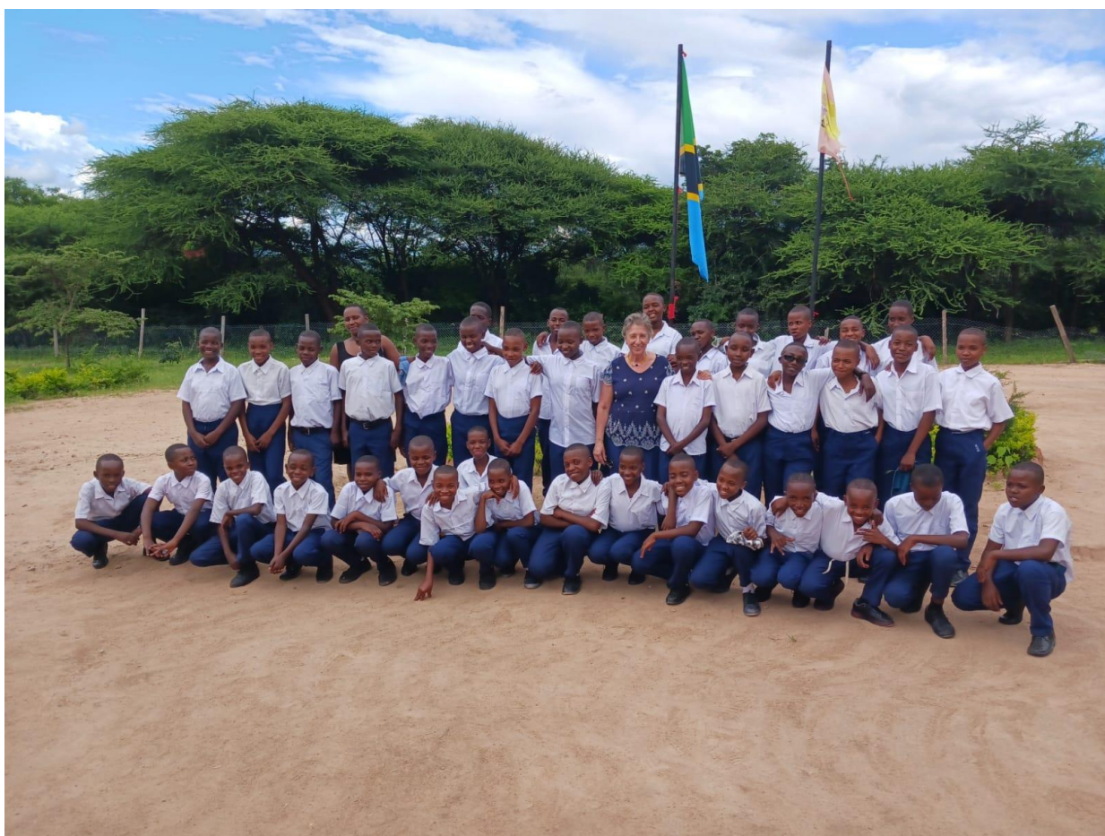
Los nuevos alumnos del curso 2024 con la Presidenta de Educa Tanzania.